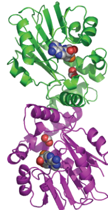
図2(右). TT1324の2量体構造。それぞれのサブユニットを緑と赤紫で示す。